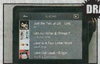
Astell&Kern 為 AK120 度身訂造 Jason Mraz 《Love Is A Four Letter Word》高質版音樂。

AK120 用上兩枚 Wolfson WM8740 芯片處理左右聲道，分析力比上代明顯提升。不過 HM-901 同樣內置兩枚 DAC 芯片獨立處理雙聲道，最大分別是選用 ESS ES9018 DAC 芯片，難怪兩者嘅音色都達至萬元唱盤水平。今次以近 $3,000 的 HiFiMAN RE-600 入耳式耳機試聽 Hi-res 音樂，兩機音色飽滿之餘，高低頻延伸度高，只係兩者音色風格略有不同，HM-901 較重 Hi-Fi 味，可將音色調至 Vintage 模擬復古味道，至於 AK120 就音樂味重啲，較有時代感。