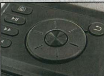
AK120 支援輕觸操作，加上 Size 細啲，明顯更方便。 ■復古設計的 HM-901 主要以轉盤操控，冇得篤芒。