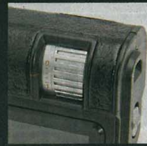
HM-901機頂加入仿皮革設計，音量掣可作25級調校。

機Gor睇見HiFiMAN HM-901個包裝寫住「Made in China」，心入面都有少少猶豫，但音響舖老死話，其實三年前佢嘅HM-801，已經係美國「響朵」，加上HM-901未推出前，喺網上被熱烈討論，證明新機被發燒友認同。打開盒，見佢嘅機身仲大部過iPod Classic，咁大Size全因佢可以換硬件，如日後想Upgrade的話，加錢換張「平衡卡」就搞掂，今次主機搭張卡就盛惠$9,824。