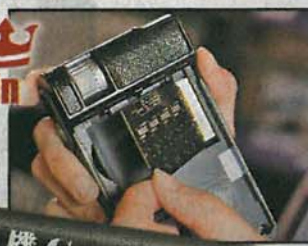
HM-901 平衡卡的更換方法同換 RAM 一樣，卡身備有 4 枚 OPA627 放大芯片。