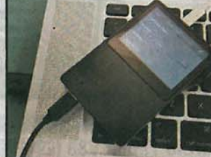
軟件升級至 1.21 版本後，便可接駁電腦作 USB DAC 解碼，功能靈活。

AK120 的擴充主要靠 Firmware 升級，無幾耐之前就加入咗 USB DAC 解碼功能，現時已支援 DSD (Direct Stream Digital) 格式。相比之下，HM-901 就硬件加軟件雙管齊下，軀體有得升級之外，仲有得換平衡卡。老友話如果跟之前成名作 HM-801 嘅做法，仲會出埋 Mini-box 卡或者 IEM 卡，只要捨得花錢，一部機可有幾種玩法，機 Gor 就幾 Buy 這種靈活做法，起碼唔使成日換機喇。