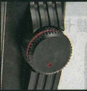
AK120配上音量調節旋鈕，設計都幾有型。

AK120鋁金屬機身配合輕觸操控，外形似足時下嘅隨身聽，但睇真啲佢個樣，點解同早幾個月推出嘅AK100一模一樣，但價錢貴咗成倍？原來佢將芯片由一張變兩張，分別獨立處理左右聲道，而且插卡位一個變兩個，連內置記憶體都加倍。價錢和音色都Double Up，發燒友Buy唔Buy先？開音響舖嘅老死話，初落場時去貨比較慢，但自從新Firmware出咗後，反應好咗好多，皆因對應埋DSD格式呀！