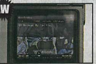
HM-901 可將音色模擬至 Vintage 味道，無論高質音樂或普通 MP3 都充滿復古味。