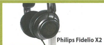
Philips Fidelio X2