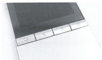
●機面轉為4個操作按鍵