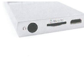
●跟SuperMini不同，簡化為單端3.5mm輸出